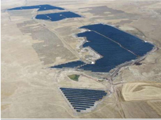
Kars Arazi GES

Arazi Ges santrali projemizin ikinci fazı olarak planlanan yatırım ile birlikte kullandığımız elektriğin tamamı GES santrallerinden karşılanıyor olacaktır.