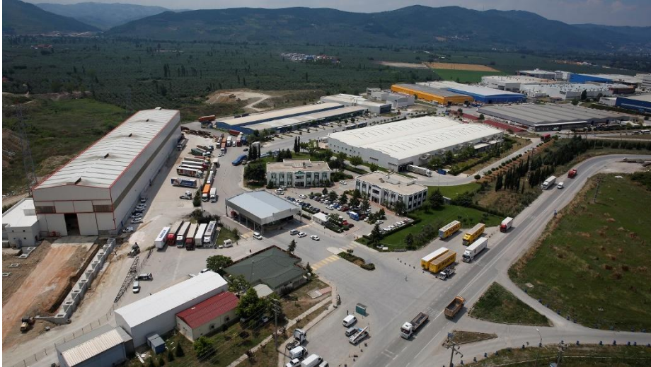
Bursa Serbest Bölgesi (BUSEB)

BUSEB Türkiye'deki Serbest Bölgeler arasında kendi arazisine sahip olan bölgelerdendir. Bu sebepten dolayı firmalar BUSEB'de arazi satın alabilmekte ve faaliyetlerine sahip oldukları arazi üzerinde yapabilmektedirler.