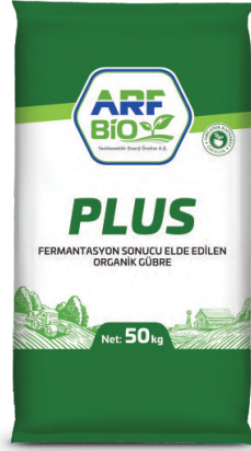
ARF BİO PLUS