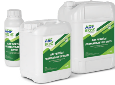
ARF FERBİOS FERMANTASYON SIVISI