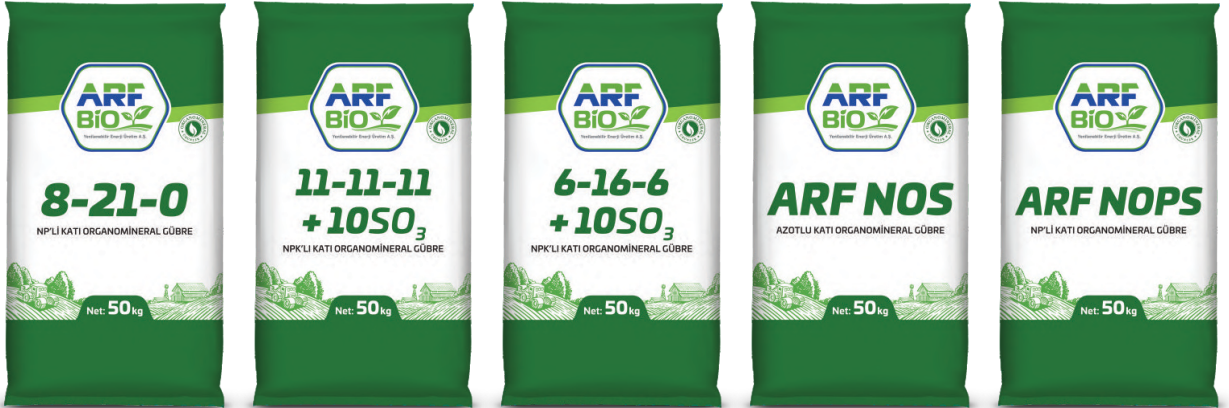
ARF BİO 8-21-0