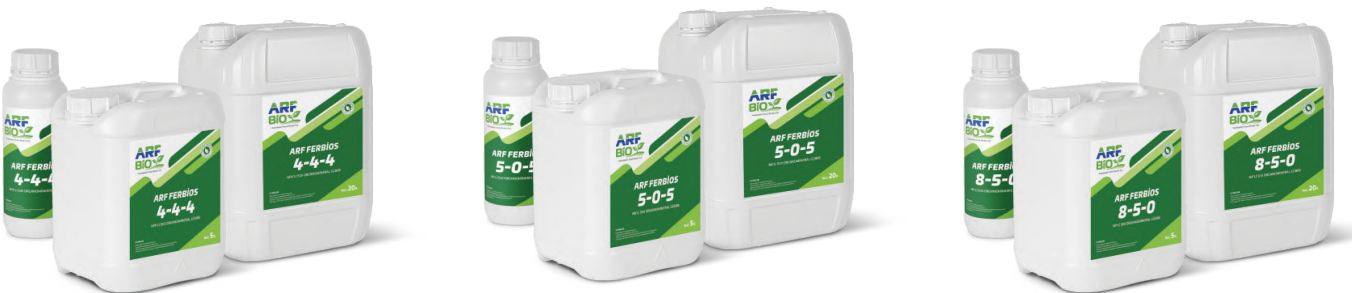
ARF FERBİOS 4-4-4