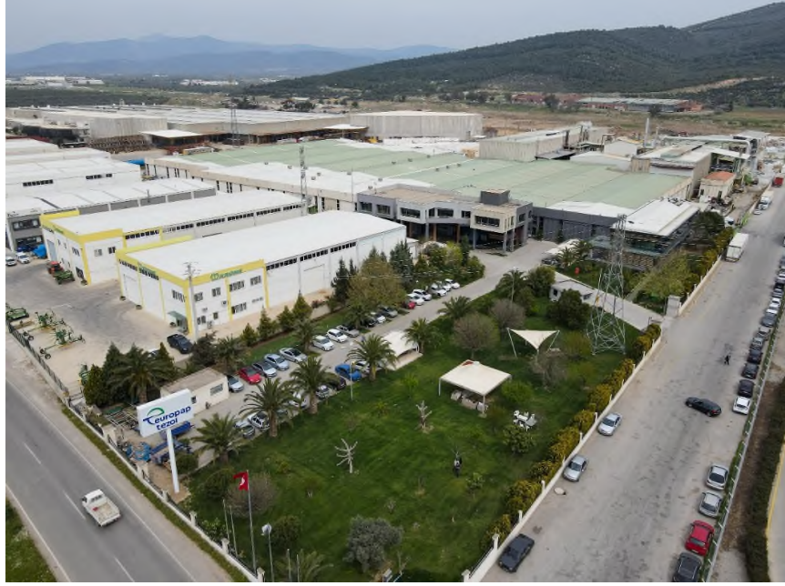
Europap Tezol Şirket Merkezi ve Torbalı-İzmir Fabrikası