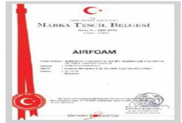
AIRFOAM Marka Tescil Belgesi