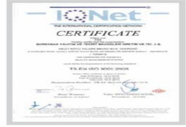
BR BERKOSAN Net Certificate