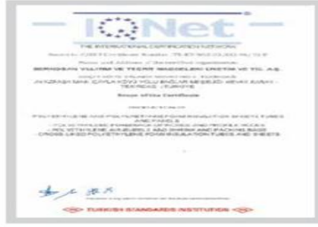
BR BERKOSAN Net Certificate