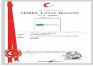
BR BERKOSAN Marka Tescil Belgesi