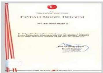
Faydalı Model II Belgesi