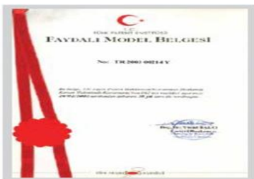
Faydalı Model I Belgesi