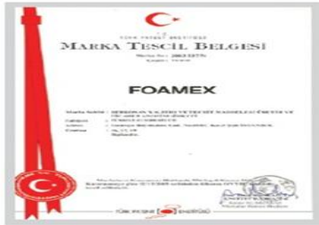
FoameX Marka Tescil Belgesi