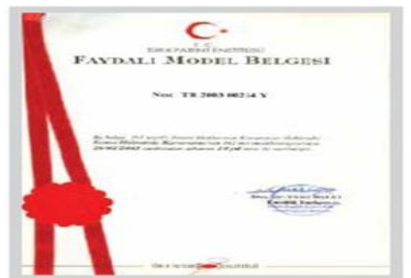
Faydalı Model III Belgesi