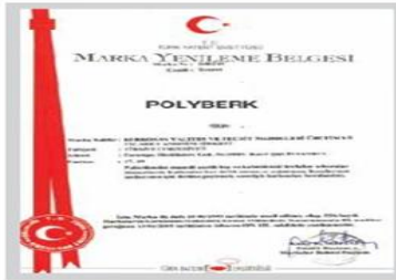
POLYBERK Marka Tescil Belgesi