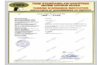
POLYBERK TSEK Belgesi