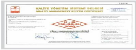
BR BERKOSAN Kalite Yönetim Sistemi Belgesi