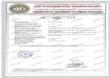
FoameX TSE Belgesi