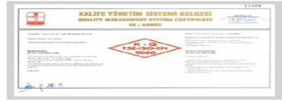
BR BERKOSAN Kalite Yönetim Sistemi Belgesi Ek