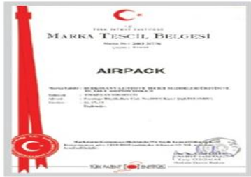
AIRPACK Marka Tescil Belgesi