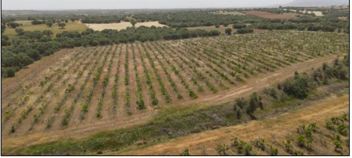
Uşak, Eşme Tarım Alanları