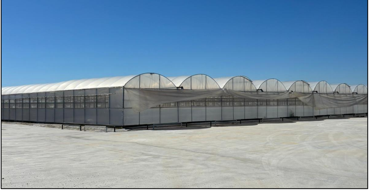
Antalya, Serik Sera

Tüm bu adımlar, şirketimizin modern tarımın öncülerinden olma ve uluslararası pazarlarda rekabet gücünü artırma vizyonunun önemli bir parçası olacaktır.