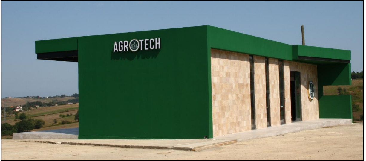
Samsun, Bafra ve Ondokuz Mayıs Tarım Arazileri

Üretim tesisimizde 2 katlı lojman, 4 katlı idare binası, 3 adet soğuk hava deposu, kanal ve servis yolu bulunmaktadır. Bunun yanı sıra 80.000 ton kapasiteli sulama havuzumuz ile üretim süreçlerini destekliyoruz.