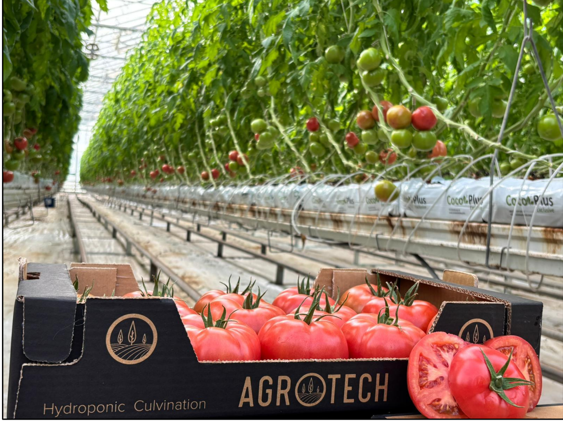
Balıkesir, Burhaniye Cam Sera