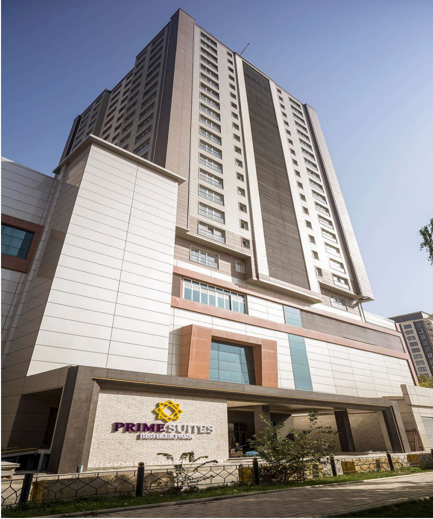
Prime Suites Residence

Prime Suites Residence, Bishkek Park AVM üstünde komşusu Sheraton Bishkek Hotel ile birlikte yan yana yükselmekte, 24 katlı ve toplam 12.500 m2 kapalı alanıyla Kırgızistan'ın en yüksek binalarından biridir. Toplam 92 konut barındıran binada 1+1'den 3+1'e kadar konut seçenekleriyle 7 farklı daire tipi mevcuttur. Prime Suites Residence bu konutlardan 44 tanesi ile kiralama hizmeti vermektedir.