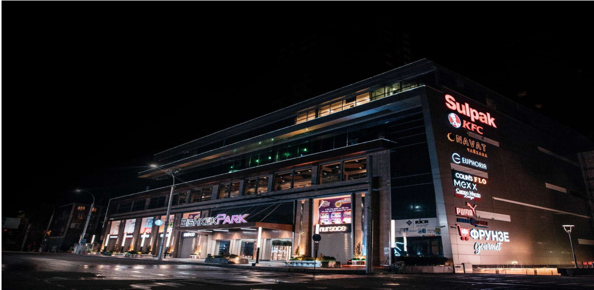
Bishkek Park AVM