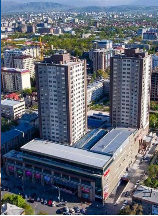
Bishkek Park Kompleksi