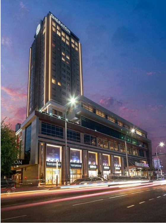
Bishkek Park Kompleksi