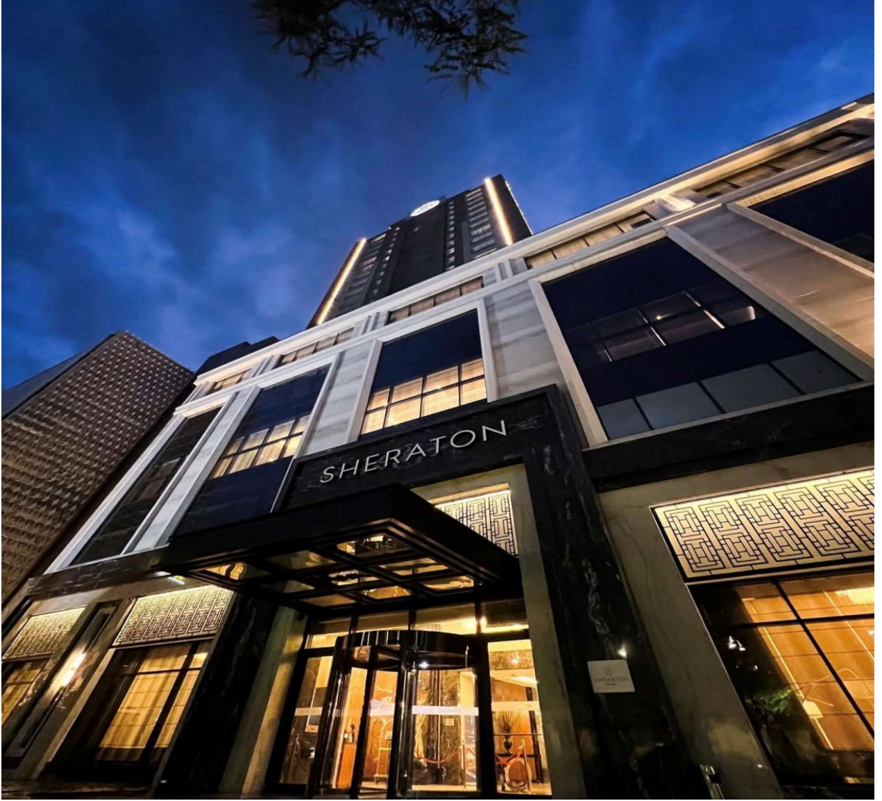
Sheraton Hotel Bishkek

Eylül 2019'da faaliyete başlayan Sheraton Bişkek Otel 24 katlı toplam 25.000 m2 alanı ile kral, süit ve standart olmak üzere toplam 400 yataklı odalarıyla 1.000 kişilik toplantı, kongre ve balo salonları, havuz, fitness, spa, patisserie ve 4 farklı dünya restoranı ile hizmet vermektedir.