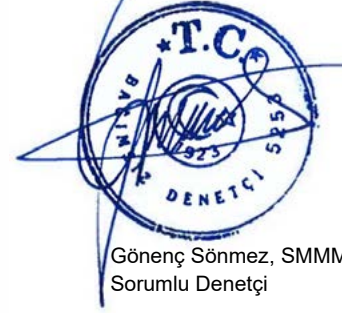
Gönenç Sönmez, SMMM Sorumlu Denetçi

Sınırlı güvence denetiminde uygulanan prosedürler nitelik ve zamanlama açısından makul güvence denetimine göre farklılık gösterir ve bu prosedürlerin kapsamı da daha dardır. Sonuç olarak, sınırlı güvence denetiminde elde edilen güvence seviyesi, makul güvence denetimi yürütülmüş olsaydı elde edilecek olan güvence seviyesine göre önemli ölçüde düşüktür.